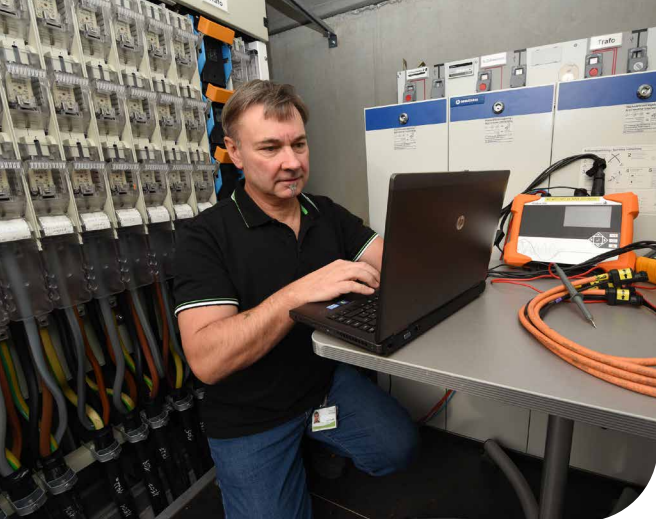
Messgeräteinsatz in einer Ortsnetzstation